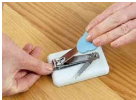
改装指甲鉗 Adapted Nail Cutter