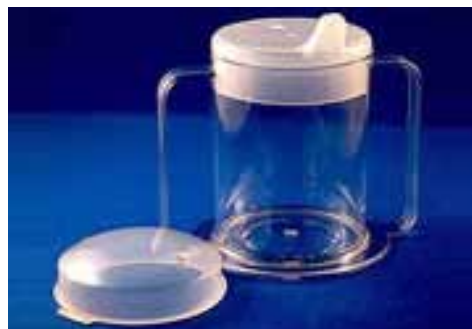
特製杯 Adapted Cup