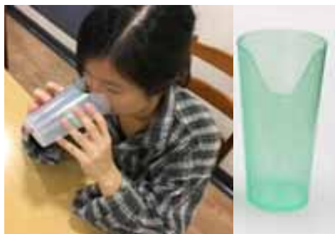
特製杯 Cup with Cut Out