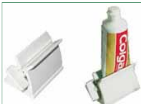
牙膏擠壓器 Toothpaste Squeezer

如有任何疑問，可諮詢本院職業治療師 For any enquires, please contact Case Occupational Therapist