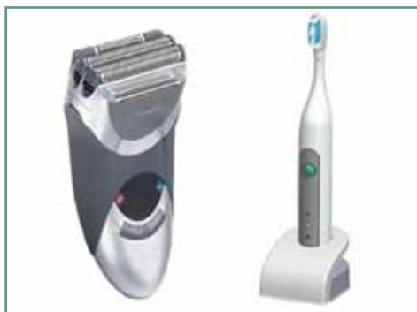
鬚刨 / 電動牙刷 Shaver or Electric Tooth Brush