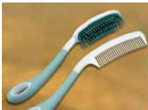
長柄梳 Long-handled Brush