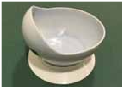
高邊碗 Scooper Bowl

Plates, bowls, cups and cutlery with special design make holding and scooping easier for patients with inadequate upper limb control.