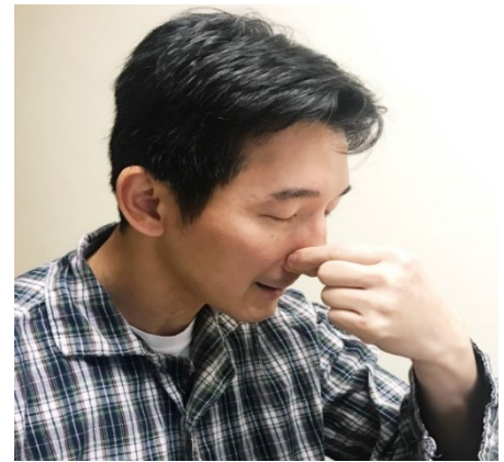
(圖 1: 頭向前俯)