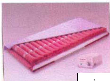
ที่นอนเป่าลม

นี่เป็นเพียงส่วนหนึ่งของการให้ช่วยเหลือทั่วไปสำหรับผู้ที่โรคหลอดเลือดสมอง หากคุณมีคำถามใด ๆ โปรดปรึกษานักกิจกรรมบำบัดของคุณ