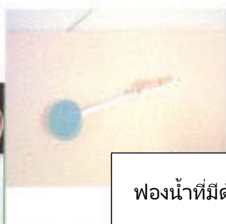
ฟองน้ำที่มีด้ามยาว