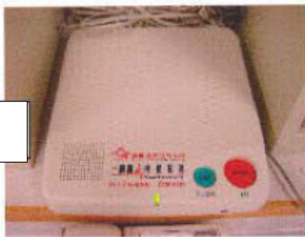
ระบบเตือนภัยฉุกเฉิน