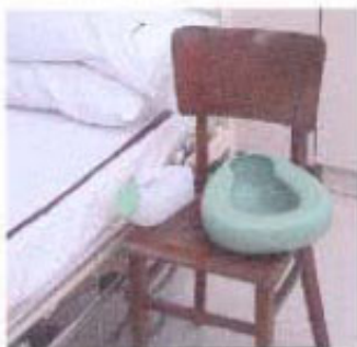
โถปัสสาวะ / ถาดรอง