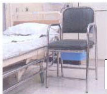
เก้าอี้สุขา