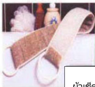
ผ้าเช็ดหลังแบบมีด้ามจับ