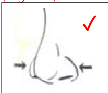
( Figura 1 ) Tama