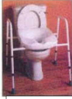
كرسى كموڈ هموى اٹھائى ساتھ كے بازوؤں