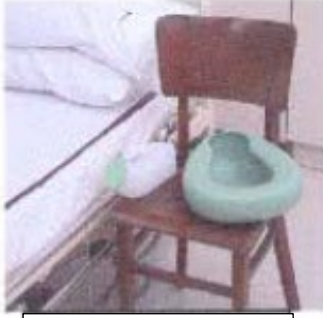
پين بيڈ / پيشاب