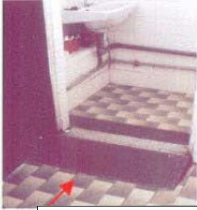
فارم پلیٹ ریمپڈ لیے کے رسائی تک چیئر وہیل