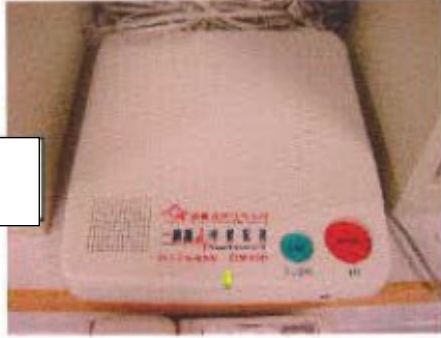
سسٹم الارم ایمرجنسی