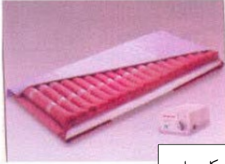
توشک کا ہوا

ہے۔ ہوا فالج کو جن ہیں دستیاب لیے کے لوگوں ان جو ہیں امداد عام کچھ صرف یہ کریں۔ مشورہ سے معالج ور پیشہ اپنے کرم براہ تو، ہیں سوالات کوئی کے آپ اگر