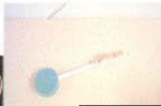
سپنج سنبھالا طويل