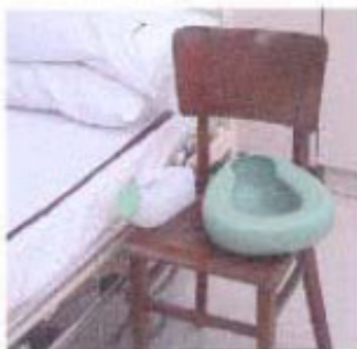
Urinal / Bedpan