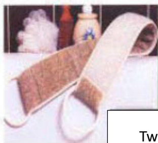
Twalya para sa likod na may hawakan