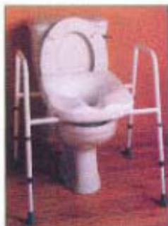
Iniangat na commode chair na may pahingahan ng kamay