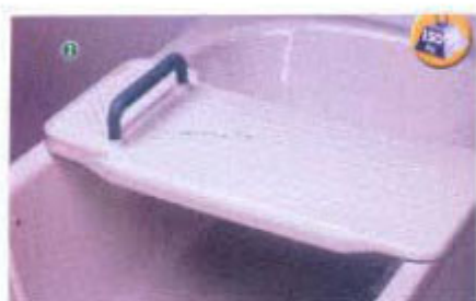
Board para sa paliligo