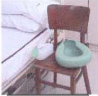
यूरिनल / बेडपैन