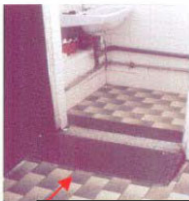
व्हीलचेयर के उपयोग के लिए रैम्पड प्लेटफॉर्म