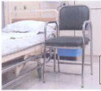
कमोड की कुर्सी