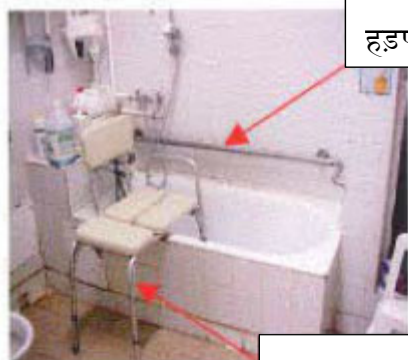
हड़पने की पट्टी