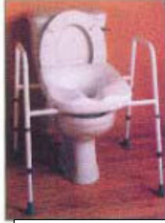
आमरेस्ट के साथ उठी हुई कमोड कुर्सी