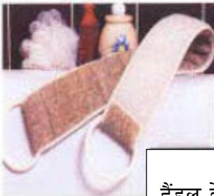
हैंडल के साथ तौलिया को पीछे से रगड़ें