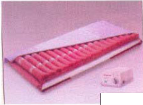
हवा वाला गद्दा

ये उन लोगों के लिए उपलब्ध कुछ सामान्य सहायता हैं जिन्हें दौरा पड़ा है।