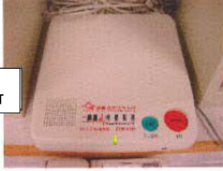
आपातकालीन अलार्म सिस्टम